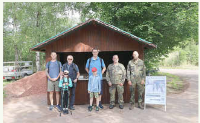
Orientieren im Gelände mit unserer Patenkompanie der Bundeswehr