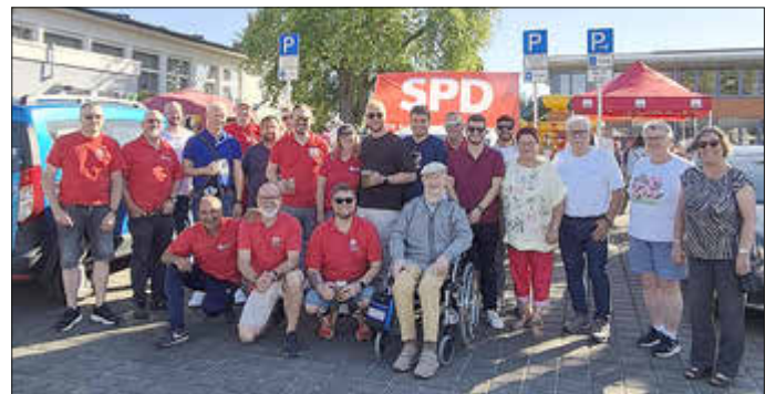
Mitglieder der SPD-Ortsvereine Schwalbach/Griesborn, Hülzweiler und Elm

Bei bestem Wetter und in toller Gesellschaft veranstaltete der SPD Ortsverein Schwalbach/Griesborn am 13.06. sein traditionelles Sommerfest auf der Wiese am Rathaus.