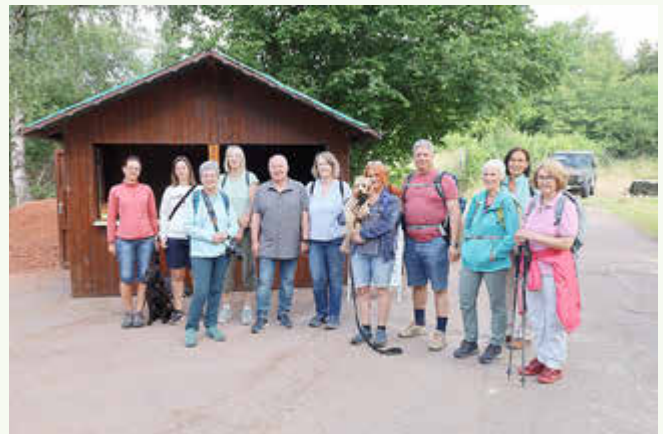
Wanderung „Rund um Hülzweiler“ mit dem Saarwaldverein