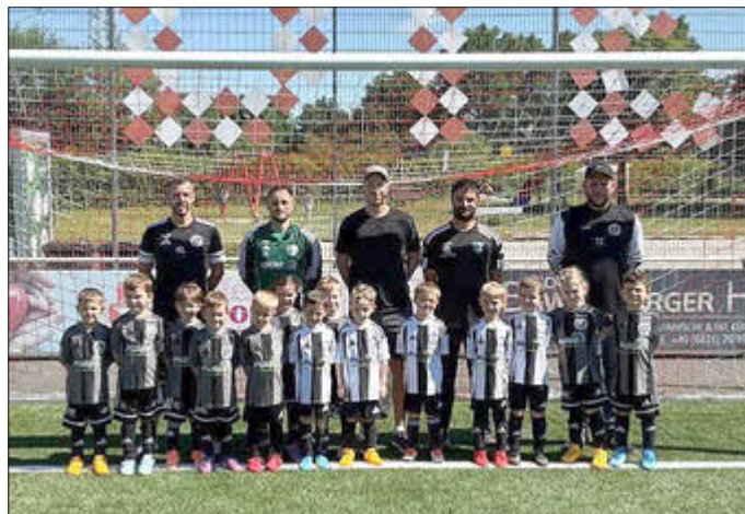
G3 und G4 bei ihrem ersten gemeinsamen Turnier in Diefflen

Die Vorfreude war riesig, und die Motivation von der ersten Sekunde an greifbar: Unsere G3 und G4 Junioren sind am Wochenende zu ihrem allerersten gemeinsamen Turnier in Diefflen angetreten – und das mit dem klaren Ziel, Vollgas zu geben!