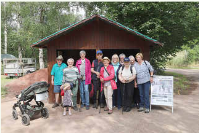
Familienfreundliche Wanderung des Saarwaldvereins