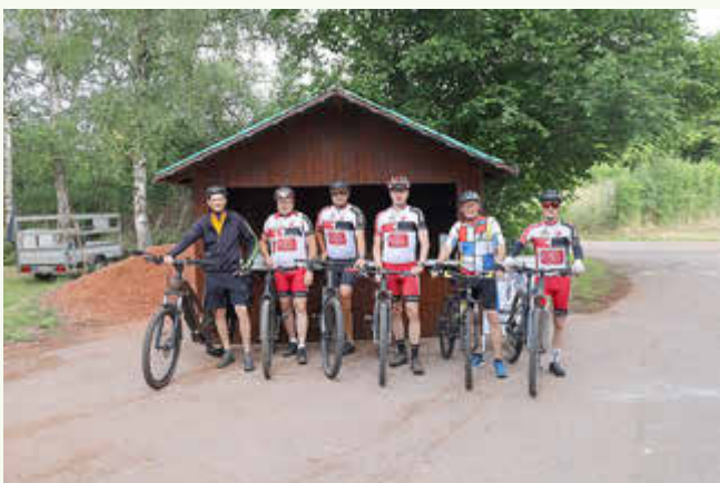
Schwalbacher Runde mit dem TV Elm