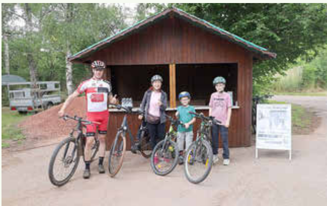
Familienfreundliche Radtour des TV Elm

Ein besonderer Dank geht an den ASV Hülzweiler für die super gute Zusammenarbeit im Rahmen des „Weherfestes“.